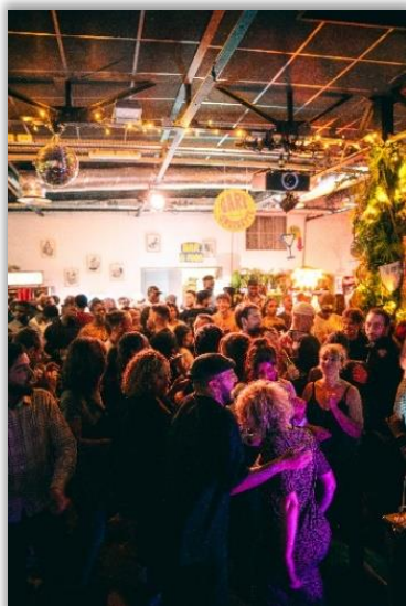
Gare Croisette

La scène électronique sera portée par des DJs et collectifs reconnus, parmi lesquels les SSSound DJs , collectif parisien aux influences internationales, ainsi que Mayou Picchu . En parallèle de la programmation scénique, le collectif More Girls Behind Decks , engagé pour la visibilité des femmes DJs, proposera un atelier de mix.