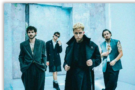
Last Train