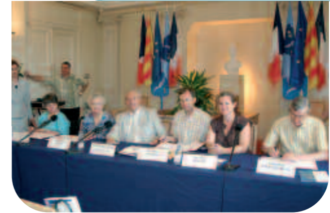
Signature de la Charte des handicapés, le 11 juin 2004